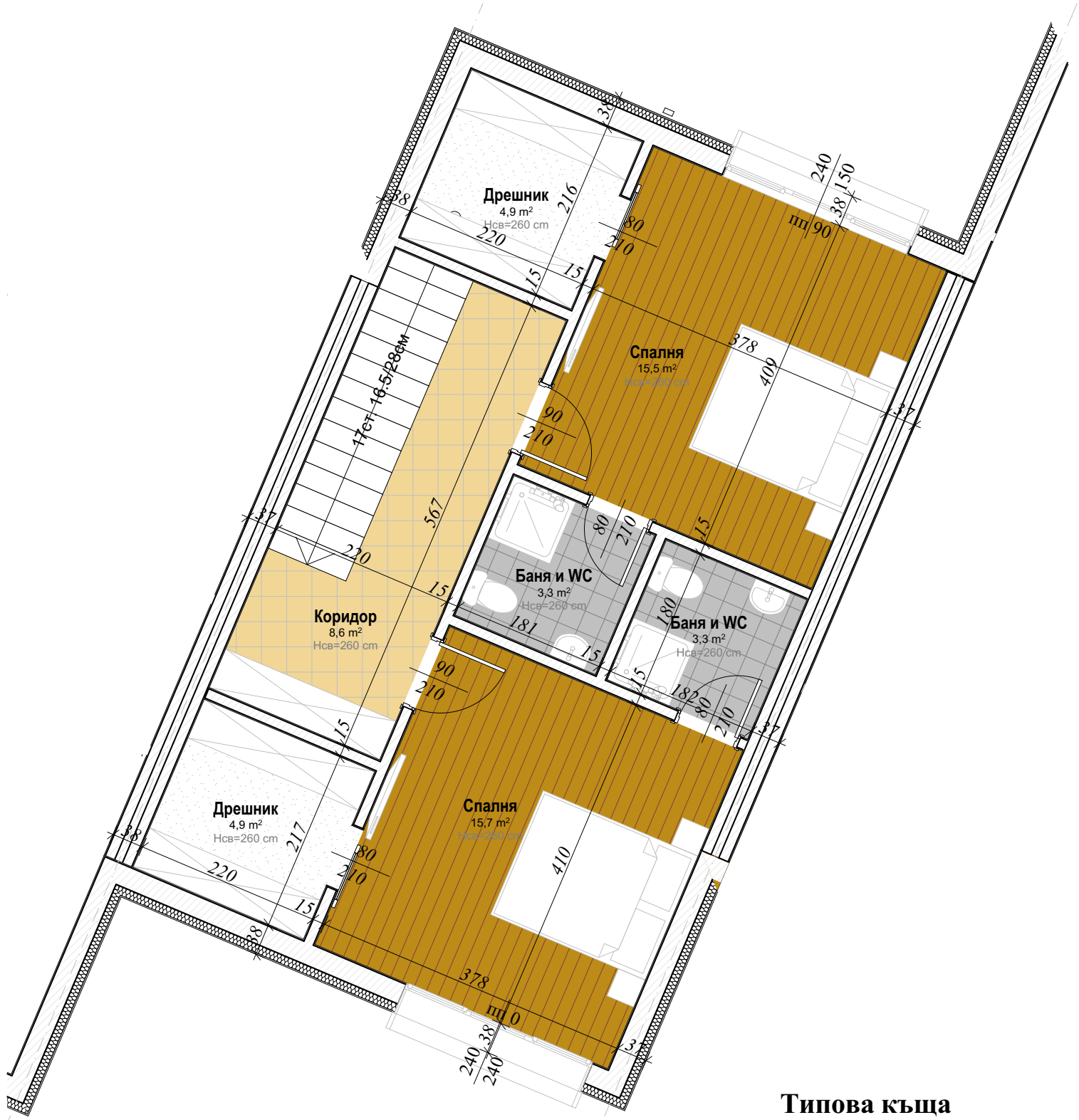
Типова къща Разпределение кота +2,80 ЗП = 76,1 кв.м.