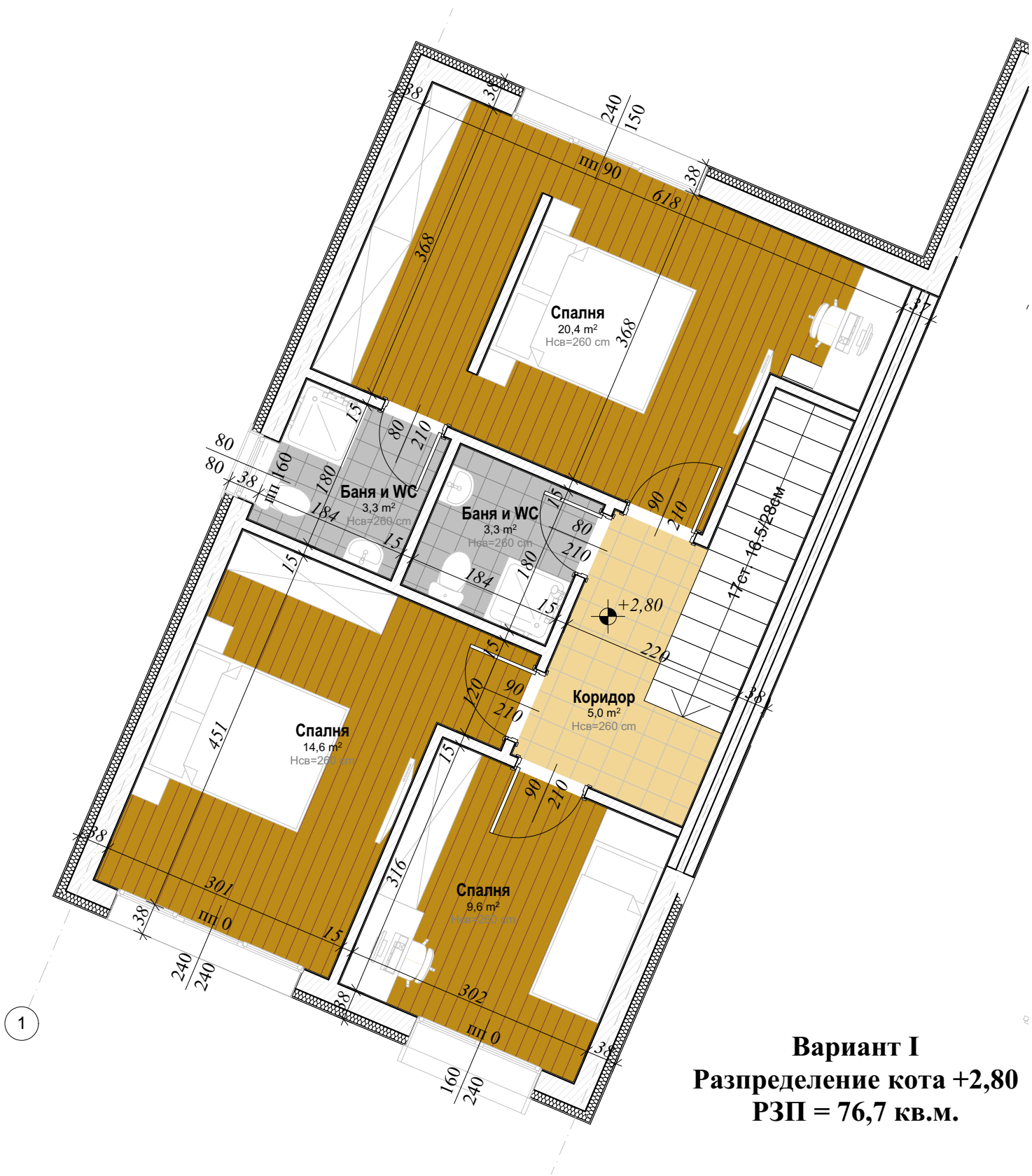
Вариант I Разпределение кота +2,80 РЗП = 76,7 кв.м.