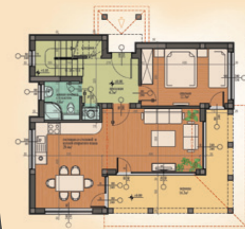
ВИЛЛА ВАНИЛА Вариант с верандой ПЛАНИРОВКА +0.00 Площадь первого уровня – 71,4м² + террасы 16,3м² Площадь второго уровня – 56,6м² Расширенная застроенная площадь – 144,3м²