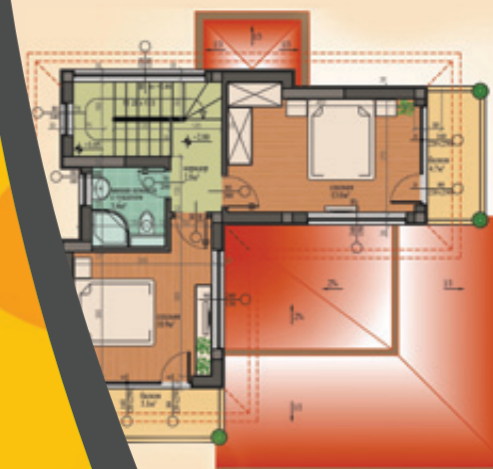
ВИЛЛА ВАНИЛА Вариант с верандой ПЛАНИРОВКА -2.80 Площадь первого уровня – 71,4м² + террасы 16,3м² Площадь второго уровня – 56,6м² Расширенная застроенная площадь – 144,3м²